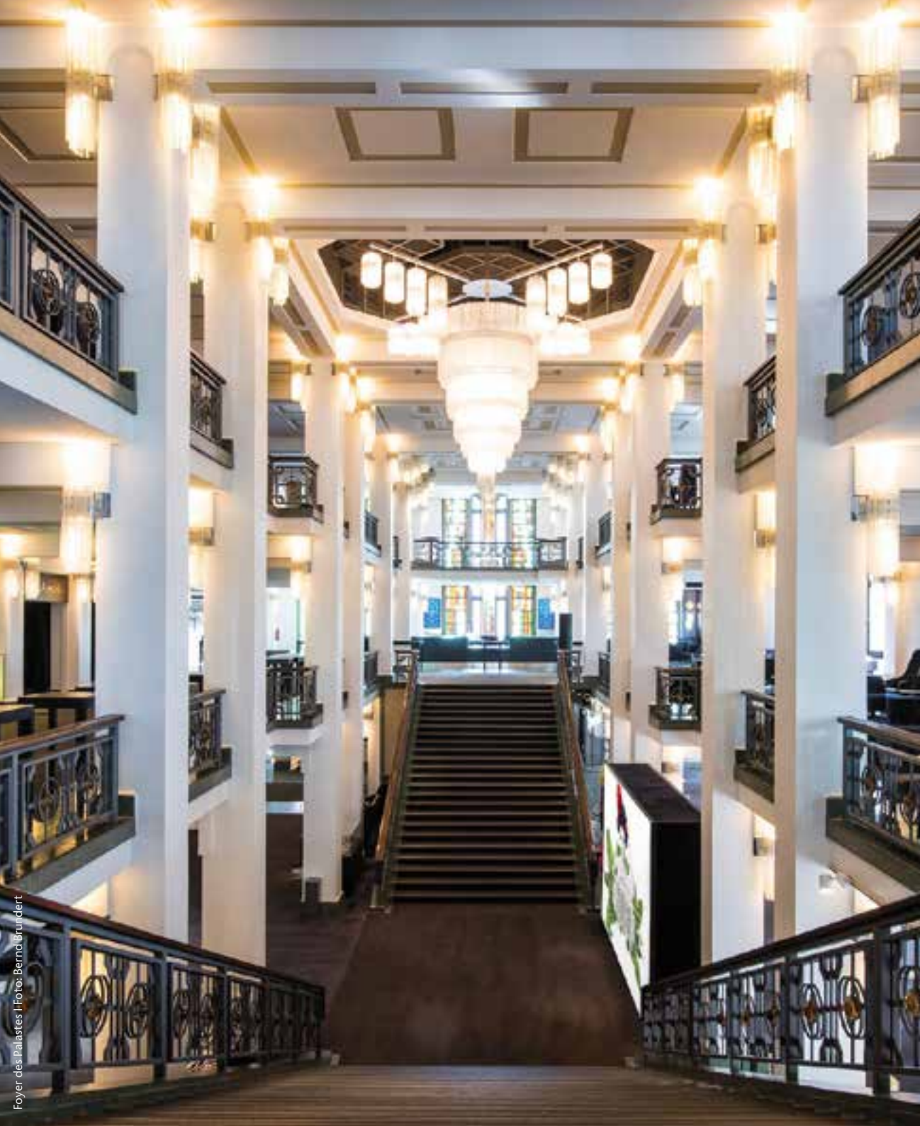
Foyer des Palastes